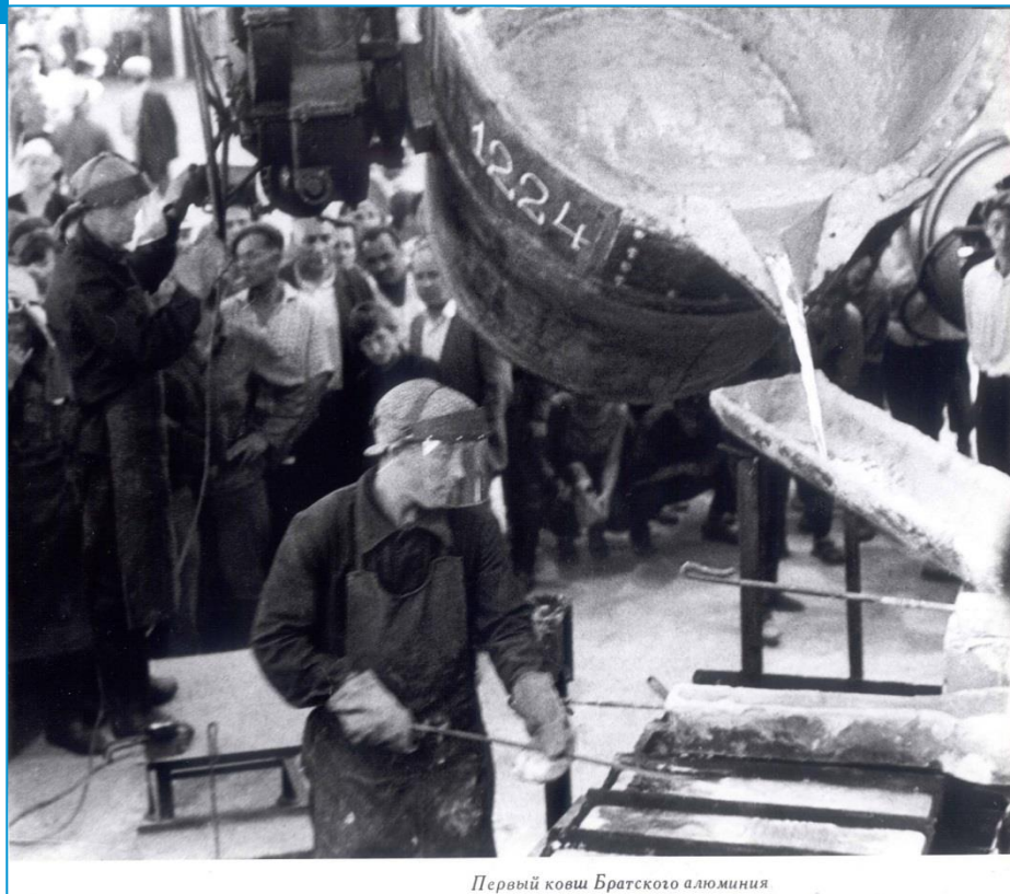
Первый ковш Братского алюминия

15 июля 1966 года первый электролизер 1224 начал работать, а 10 дней спустя был отлит первый слиток с маркой «БрАЗ».