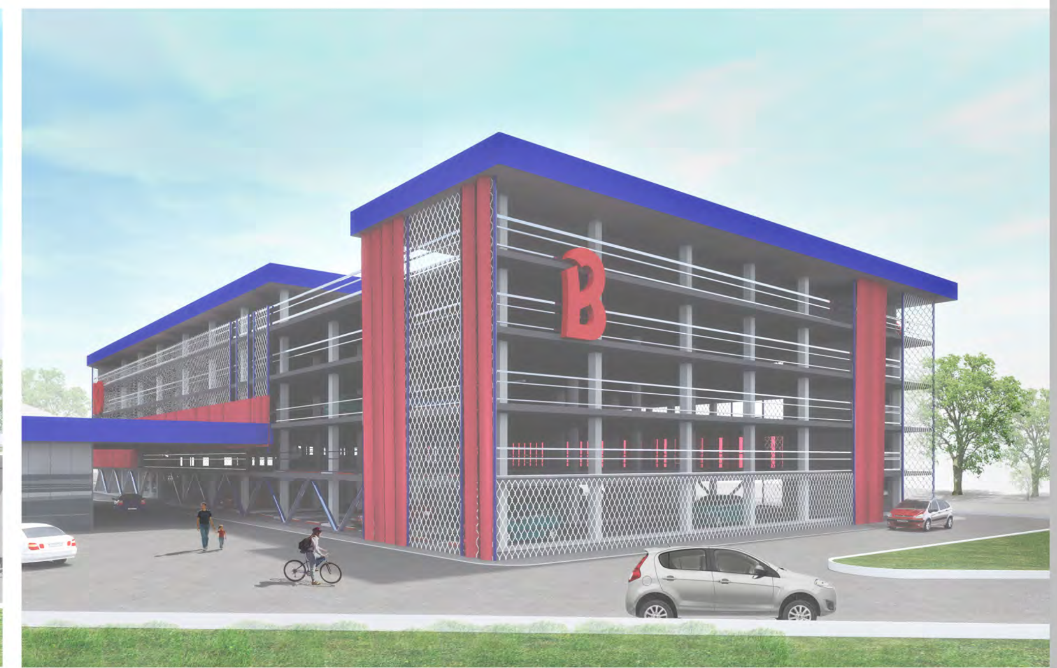
Фасад в осях 17-1